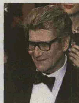
Yves Saint Laurent

All'inizio di quest'anno, l'evento colse di sorpresa anche gli analisti più ottimisti, con un risultato complessivo di oltre 374 milioni di euro, e molti record per i singoli oggetti posti all'incanto. Parliamo della ormai famosa asta della collezione di Yves Saint Laurent e di Pierre Bergé, che Christie's si ripropone ora di replicare con un nuovo appuntamento. Oltre milleduecento pezzi, in generale meno preziosi rispetto a quelli protagonisti della prima vendita, che saranno battuti ancora a Parigi fra il 17 e 19 novembre prossimi. Circa la metà di questi proviene da Chateau Gabriel, residenza della coppia nei dintorni di Deauville, in Normandia. Fra i top lots la gouache Les travailleurs au repos , di Fernand Leger , stimata fra 80 e 120mila euro, mentre la maggior parte dei lotti partirà da stime attorno ai diecimila euro.