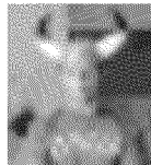
CORTESE Il performer Manusardi (foto) in via Stradella 7