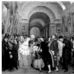
Tavola rotonda sulla pittura