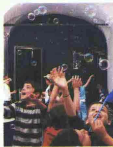
Il laboratorio di bolle di sapone

Laboratori interattivi, visite guidate e spettacoli teatrali. È un weekend speciale questo che propone il Museo della scienza e della tecnologia (via San Vittore 21) fino a domenica 27 aprile. I bambini possono scegliere tra laboratori di genetica e biotecnologie (alcuni appuntamenti sono per bambini di 7 anni, altri di 9) dove si gioca con le cellule e il Dna, laboratori di “bolle di sapone” (dai 3 anni) e