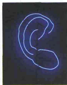
“Ascolto” di Liliana Moro

Una visita guidata al nuovo progetto di Liliana Moro che si estende sull'intera area dei due spazi del Docva, il “Documentation Center for Visual Arts” che è stato inaugurato il 4 aprile da Careof e Viarini alla Fabbrica del Vapore, in via Procaccini 4. In questi spazi ora si può ammirare “This is