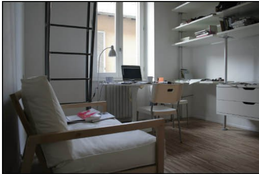
The living room