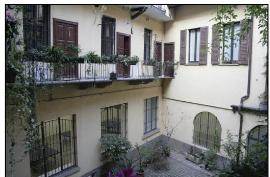
View of gallery and apartments