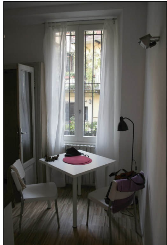
The dining area